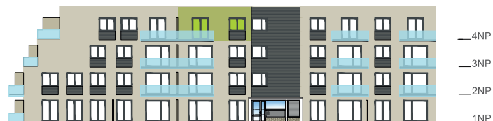
Západní pohled na dům / Building View - west side